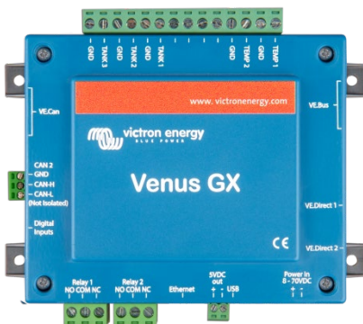
Venus GX avec connecteurs