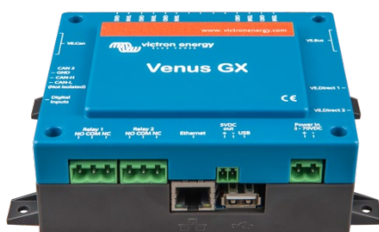
Venus GX – vue de face